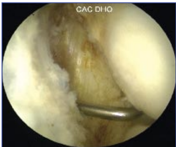
Figura 7. Tras la capsulectomía, se localiza el tendón del ECRB que tenemos que reseca.