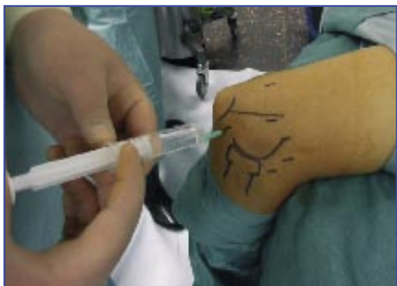
Figura 3. Distensión articular con suero a través del portal lateral directo.