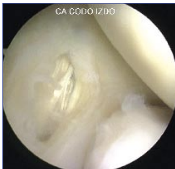
Figura 6. Al realizar la capsulectomía lateral, se pone de manifiesto la lesión tendinosa subyacente.

lizar con la precaución de atravesar anterior y muy próximo al septo fibro-muscular medial y en dirección a la articulación, posterior y distalmente para evitar lesionar, respectivamente, el nervio cubital y el paquete vasculo-nervioso anterior del codo (nervio mediano y arteria y vena humerales) durante el abordaje (Figura 4).