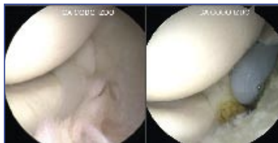
Figura 5. Imagen de una plica sinovial condilo-radial y su apertura/resección.

La introducción de la vaina del artroscopio a través del portal medial proximal se debe rea-