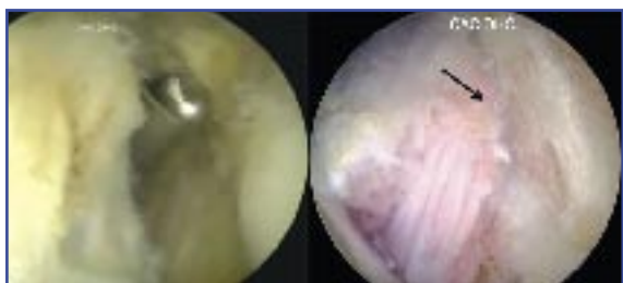
Figura 9. Imagen de la epicondilooplastia con fresa motorizada y el aspecto final del epicóndilo tras su realización (flecha).

ambos instrumentos, se practicará una resección y desbridamiento de la inserción del ECRB en el epicóndilo y de todo el tejido degenerativo tendinoso reconocible hasta comprobar que no quedan restos patológicos (Figura 8). No se debe temer por la integridad del complejo ligamentoso lateral, puesto que desde el portal de visión medial proximal y con la óptica de 30° no llega a visualizarse éste (7) .