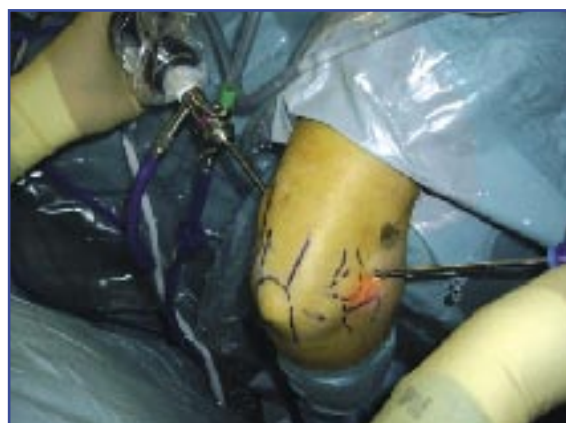
Figura 2. Detalle de las referencias anatómicas dibujadas en el codo, el portal medial proximal con el artroscopio en su interior y el portal anterolateral de trabajo con el sinoviotomo introducido.