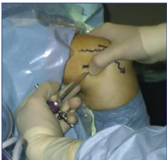
Figura 4. Detalle de la dirección de introducción de la vaina del artroscopio a través del portal medial proximal al inicio del procedimiento.

del torniquete al comienzo de la cirugía. La alternativa para alérgicos es vancomicina 1 g.