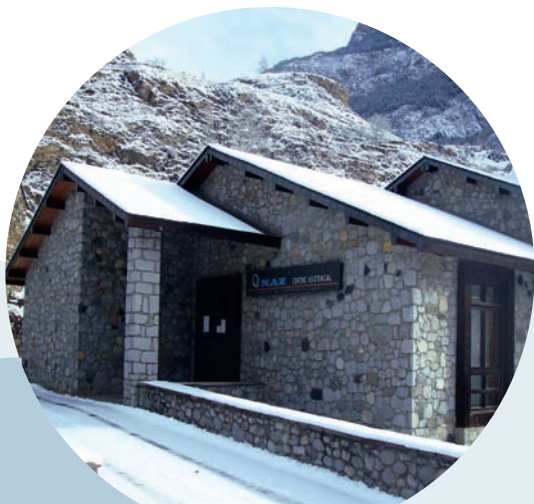
CENTRO ASISTENCIAL MAZ BENASQUE

La necesidad formativa de adquirir los mejores conocimientos posibles en el tratamiento de patologías y lesiones de rodilla viene determinada por el elevado número de accidentes, tanto profesionales como no profesionales, que sufren las articulaciones inferiores. Más de un 10% de accidentes laborales tienen como parte del cuerpo lesionada la extremidad inferior con especial incidencia en la rodilla y otras partes de la pierna relacionada con ella y en lo relativo a los accidentes domésticos y de ocio el porcentaje es mucho más alto, por encima del 33%. Estos datos avalan la importancia cuantitativa de las lesiones de rodilla y la necesidad de que los profesionales sanitarios conozcan las mejores técnicas de diagnóstico, reparación y rehabilitación.