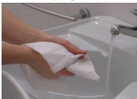
Séquelas con una toalla de un solo uso