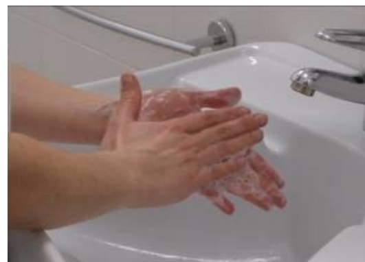
Frote las palmas entre sí