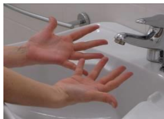
... y las manos están limpias