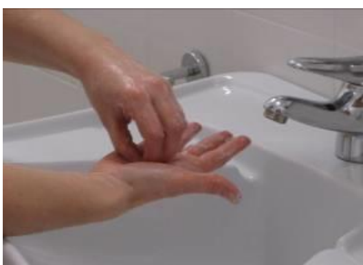
Frote las puntas de los dedos contra la palma con movimiento