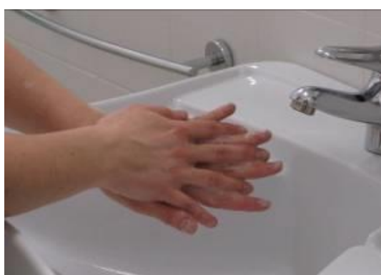
Frote la palma contra el dorso