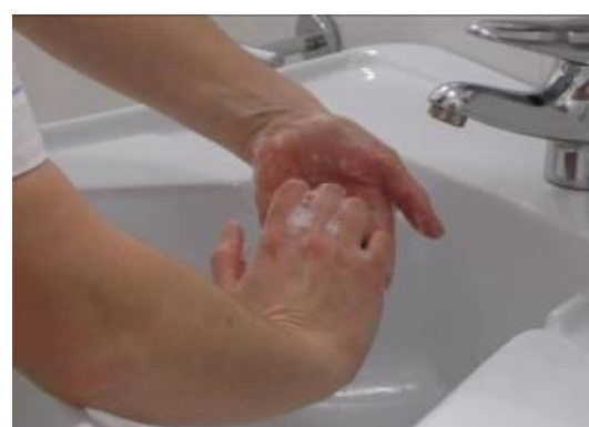
Frote el dorso de los dedos contra las palmas