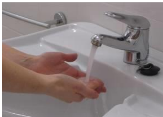
Mójese las manos con agua