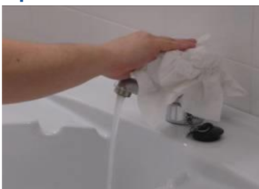
Utilice la toalla para cerrar el grifo...