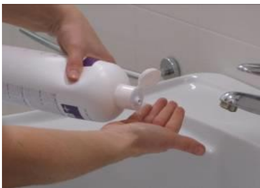
Deposite en la palma una cantidad de jabón suficiente