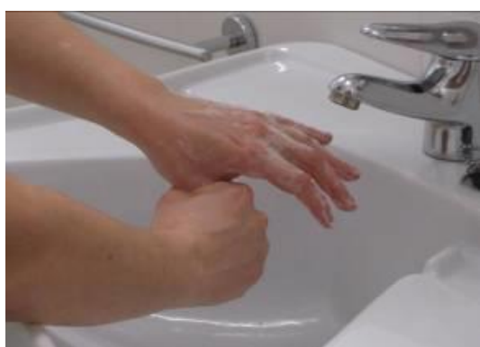
Frote con movimiento de rotación el dedo pulgar