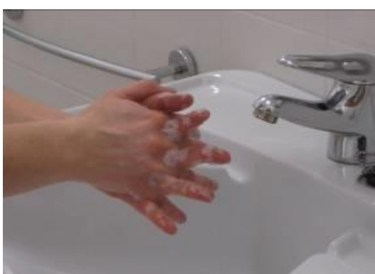
Frote las palmas con los dedos entrelazados