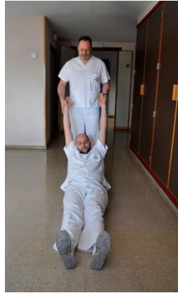
Arrastrado de las manos