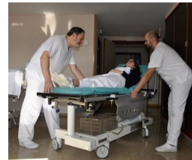
Con cama (debe evitarse por espacio de evacuación que ocupa)