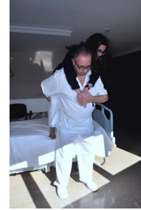
En la espalda