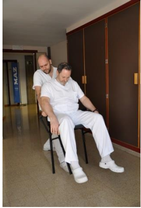
Con ayuda de una silla