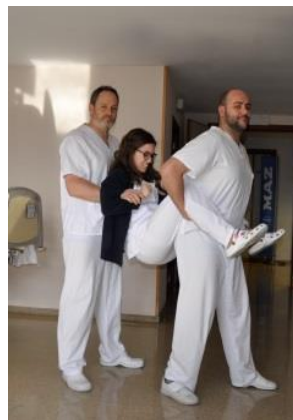
Cogiendo de espalda y piernas